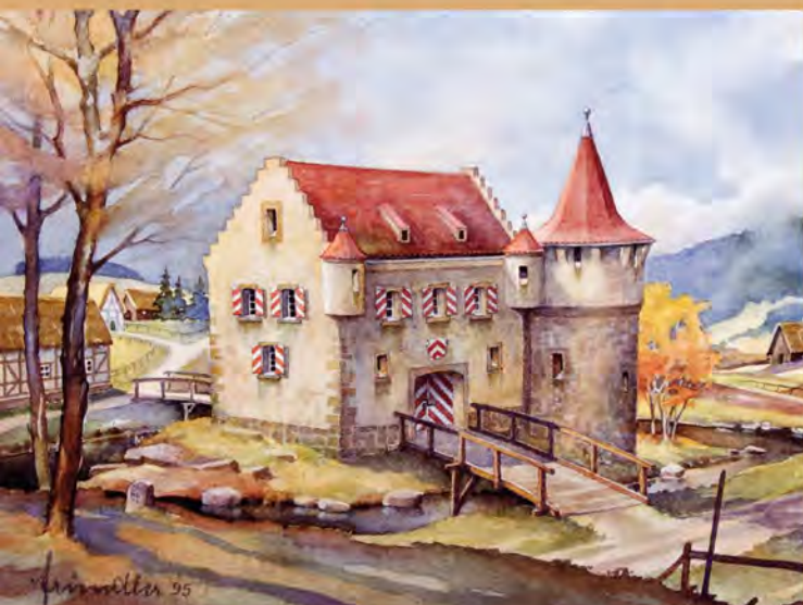
Das Sparnecker Schloss im Mittelalter vor seiner Zerstörung am 10. Juli 1523